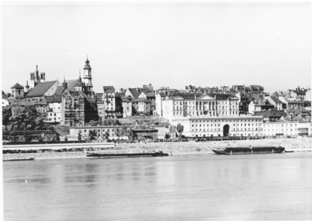
Panorama Starego Miasta od strony Wisły. 1938 r.