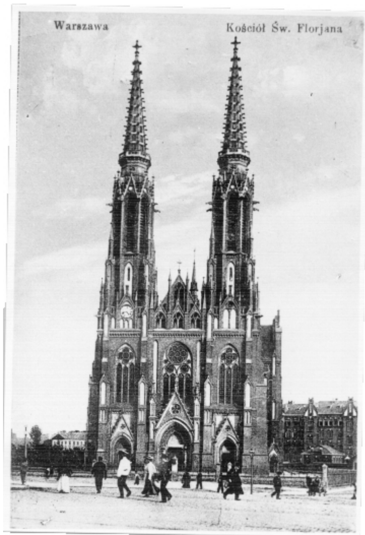
Kościół św. Floriana. Pocztówka sprzed 1915 r.