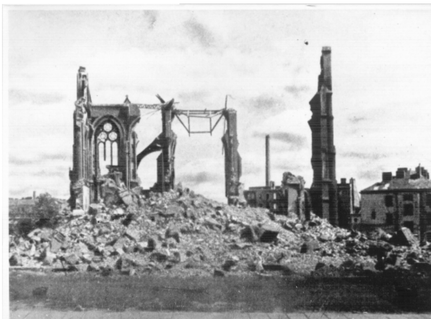
Kościół św. Floriana. Pocztówka z 1945 r.