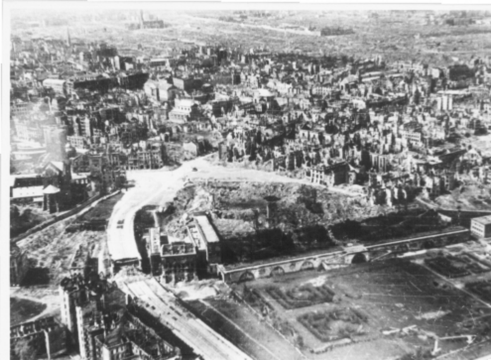
Ruiny Starego Miasta. Zdjęcie lotnicze z 1945 r.