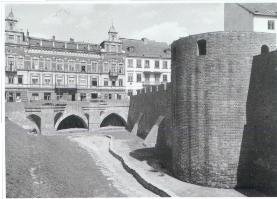
Mury obronne. Fot. H. Poddebski, 1939 r. Ze zbiorów Muzeum Historycznego w Warszawie