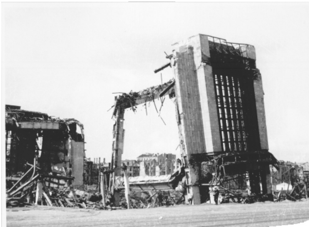
Ruiny Dworca Głównego. Koniec 1945 r.