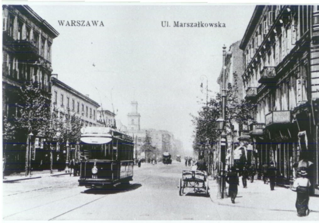
Ul. Marszałkowska przed 1915 r. Reprodukacja pocztówki.