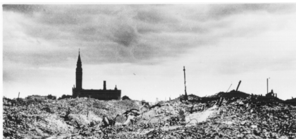
Ruiny getta i kościół św. Augustyna. 1945 r.