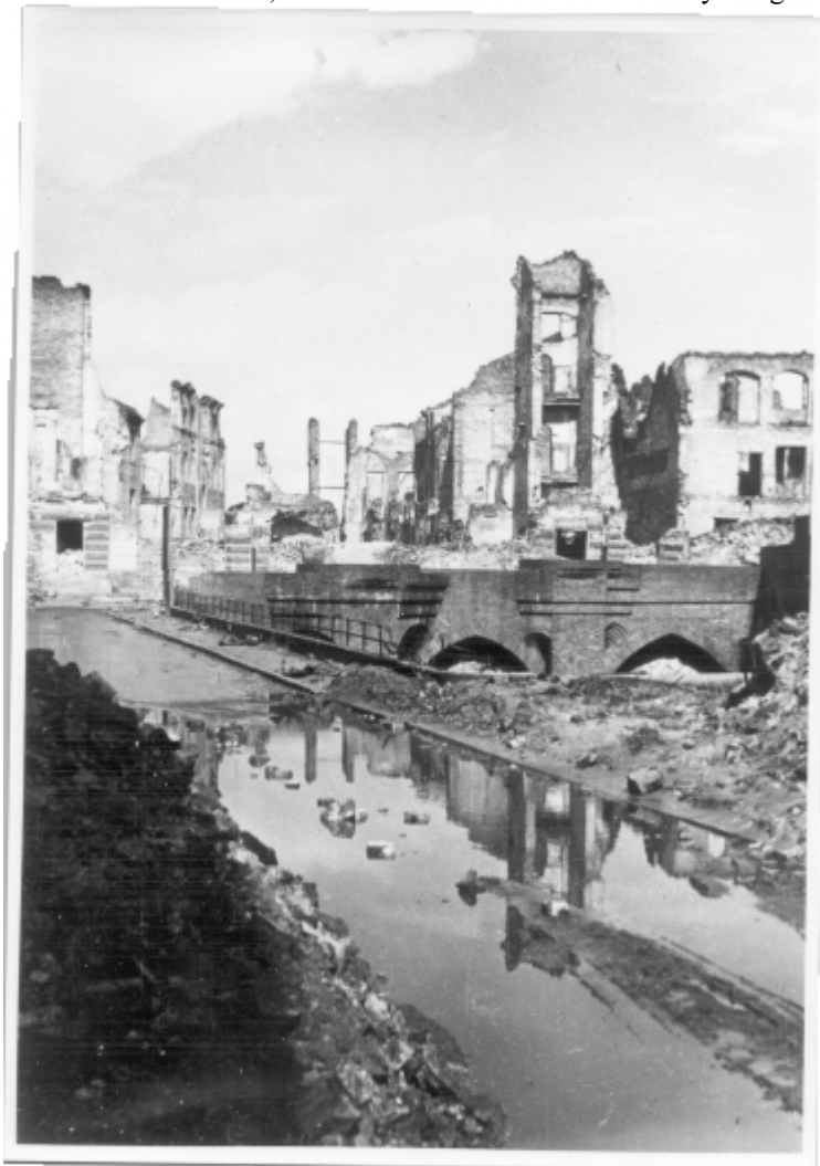
Mury obronne. Fot. L. Sempoliński, marzec 1945 r. Ze zbiorów Muzeum Historycznego w Warszawie