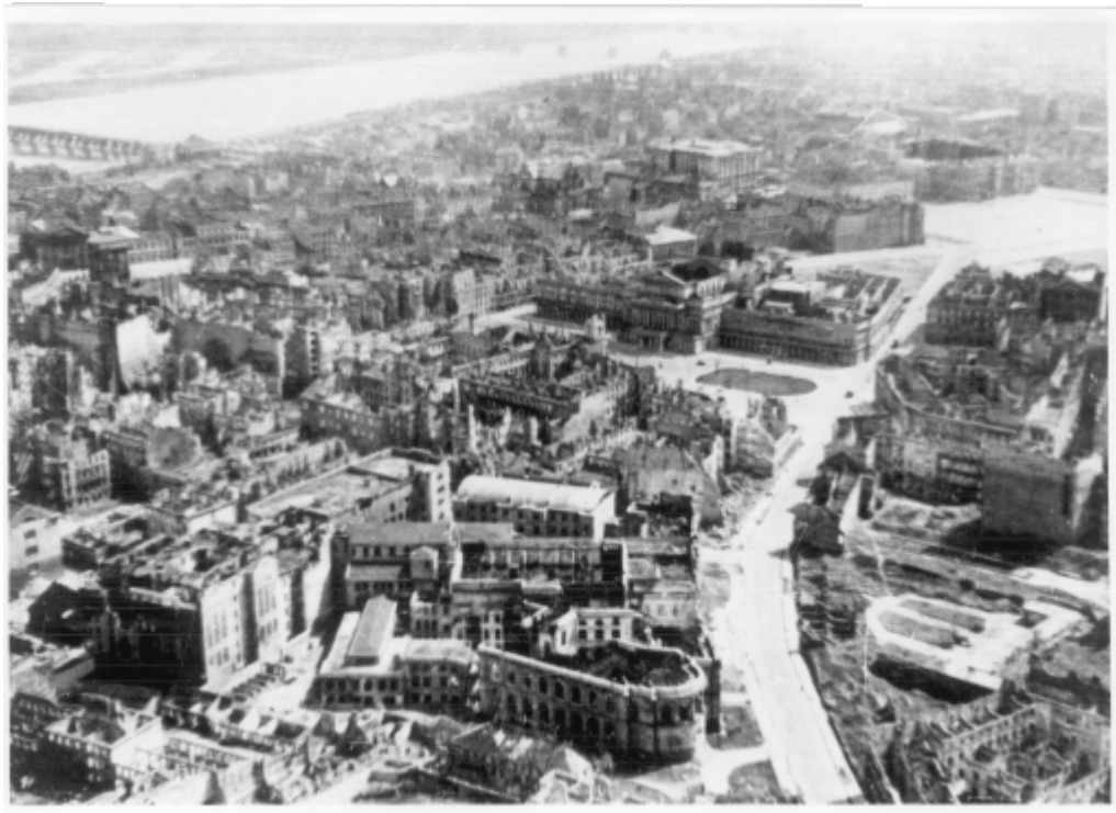
Śródmieście z ul. Bielańską, placem Teatralnym i placem Piłsudskiego. Zdjęcie lotnicze z 1945 r.