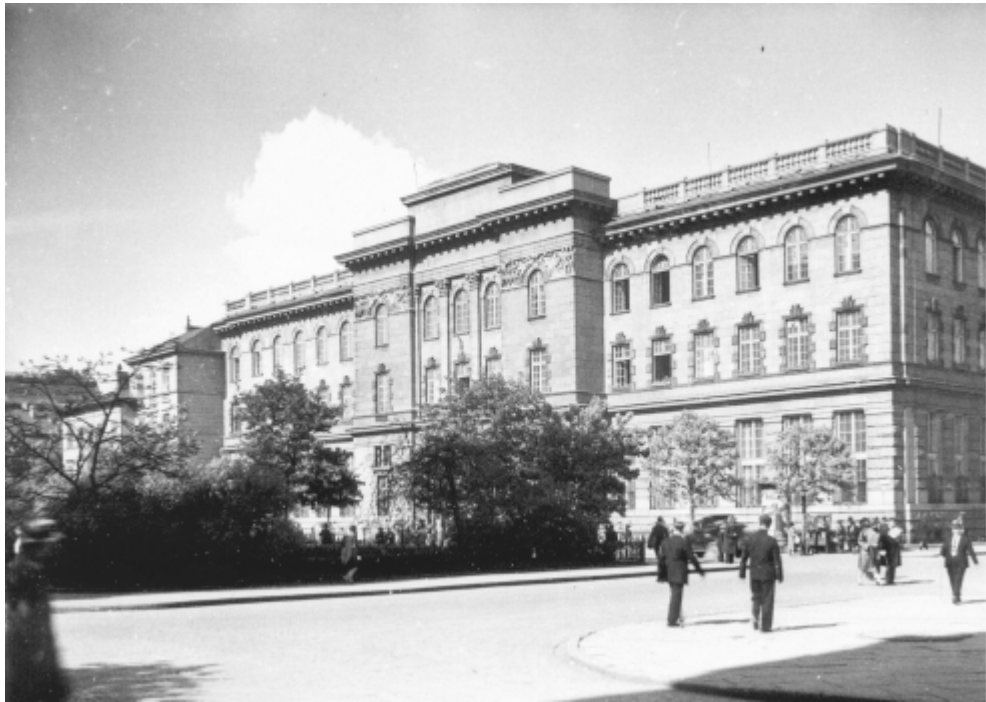
Plac Napoleona, gmach Poczty Głównej. Fot. H. Poddębski, 1930 r. Ze zbiorów Muzeum Historycznego w Warszawie